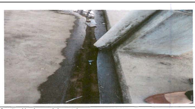
Sustitución de canal de metal

Observación: Si es necesario se pueden agregar hojas adicionales y actualizar el número de hojas.