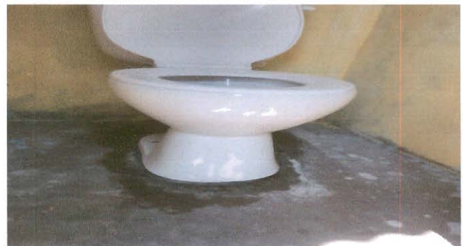
Mantenimiento de baños.