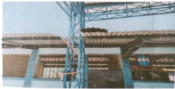
Sustitución de tubería PVC línea principal aguas pluviales

Observación: Si es necesario se pueden agregar hojas adicionales y actualizar el número de hojas.