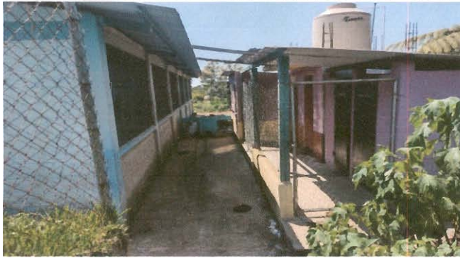
Sustitución de lámina, por lámina troquelada aluzinc calibre 26