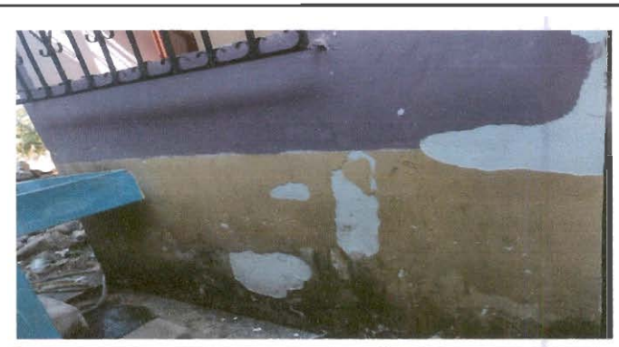
Pintura en muros exteriores e interiores