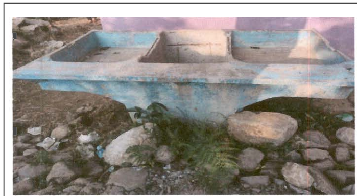
Reparación de pila.