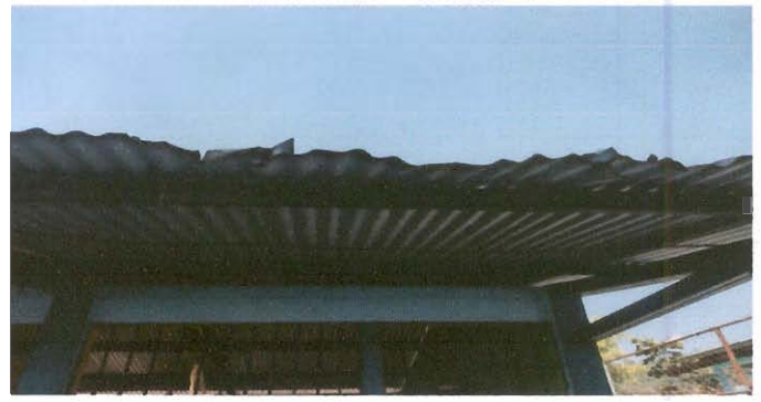
Sustitución de lámina, por lámina troquelada aluzinc calibre 26