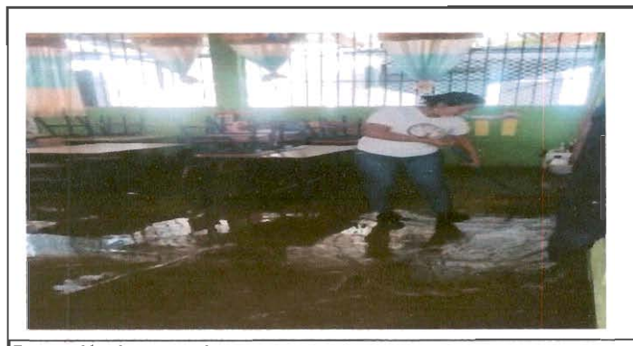
Reparación de cuneta de concreto.