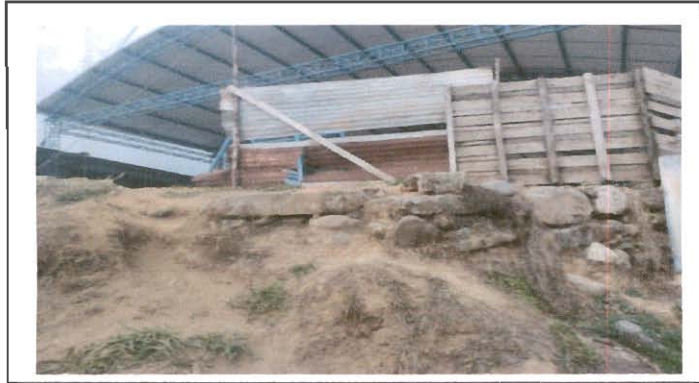
Sustitución de muro de contención