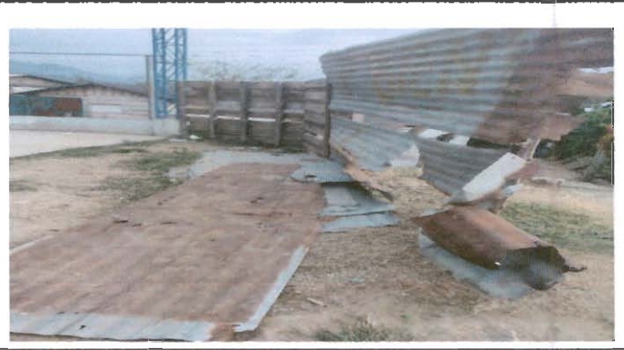
Reparación de la circulación de la escuela.