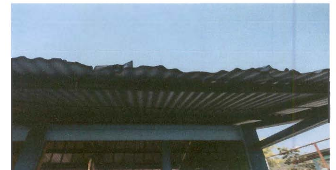
Sustitución de lámina, por lámina troquelada aluzinc calibre 26