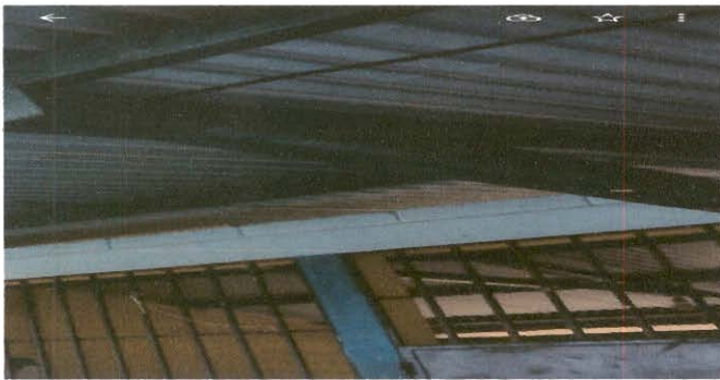
Mantenimiento de balcones.